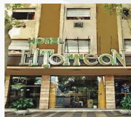
HOTEL EL TORREON